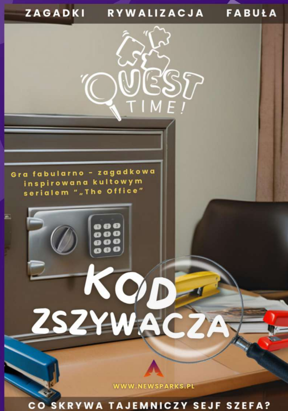
QUEST TIME! "KOD ZSZYWACZA"